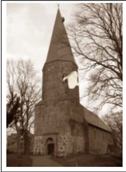
Der Kirchturm mit der weißen Fahne.

liefen wir zum Kirchturm. Das Geschieß wurde heftiger. Ich begab mich auf den Turm und steckte die weiße Fahne heraus.