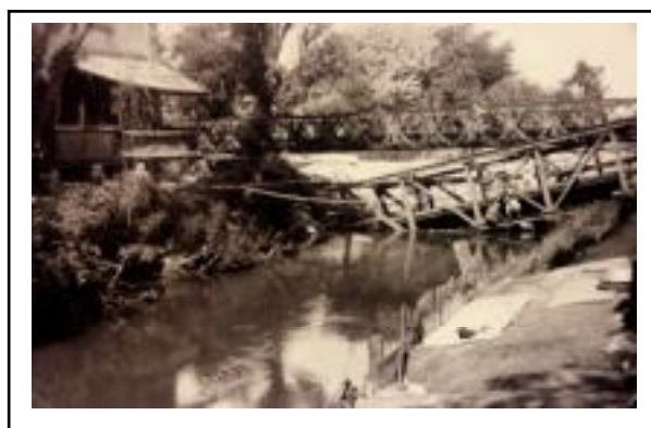
Die englische Ersatzbrücke. Die alte Brücke liegt in der Hunte.

Der Sonntag Quasimodogeniti, 8. April, brach an. Man wusste, heute fällt die Entscheidung. Weiße Fahnen hatte man vorbereitet. Auch auf dem Kirchturm hatte ich zwei große, weiße Fahnen bereitgestellt. In den Morgenstunden begann das Schießen. Dampf grollten die Abschüsse der Panzer von Richtung Cornau herüber. Zwischen neun und zehn Uhr erfolgte die Brückensprengung, die Gott sei Dank, außer schweren Schäden an den anliegenden Häusern, im Übrigen weniger geschadet hat. Die Eisenbahnbrücke hatte man schon vorher gesprengt.