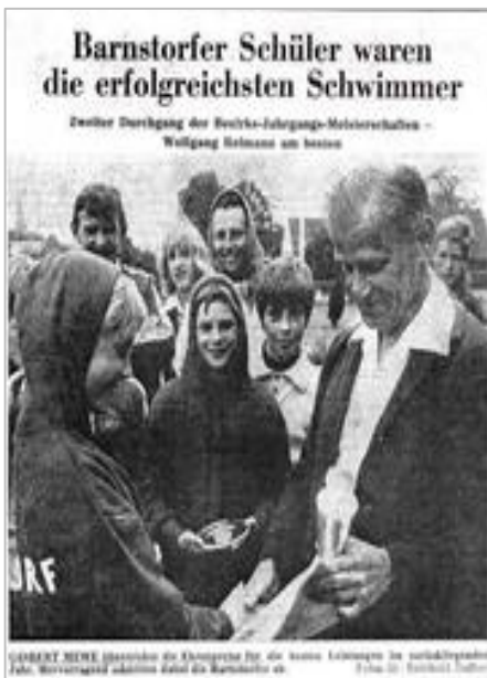
1973 Ehrung der jahresbesten Schwimmer der SG Barnstorf