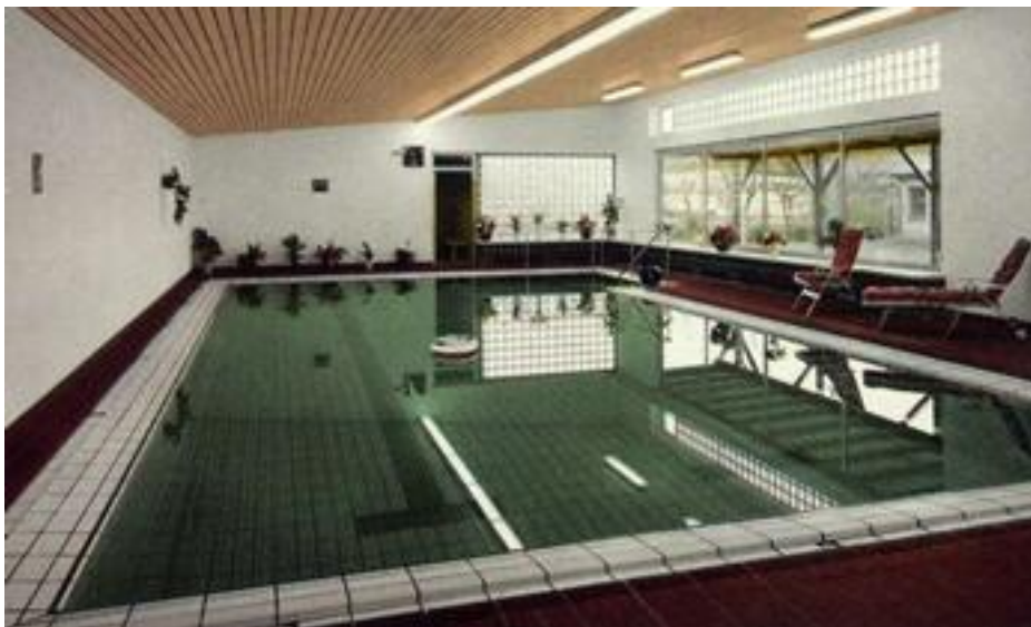
Hotelschwimmbad Roshop mit zwei 12,5 m-Bahnen

Zum 1. Vorsitzend wurde der Hotelier Ludwig Roshop gewählt. Dieser hatte im Jahr 1971 eine weitere Schwimmmöglichkeit in Barnstorf geschaffen. Er errichtete ein Hotelbad mit zwei 12,5 m langen Bahnen. Dazu wurde auch eine Sauna und ein Fitnessraum eröffnet. Das Bad war und ist neben den Hotelgästen auch den Barnstorfern zugänglich. Das wurde sogleich auch von den aktiven Schwimmern angenommen. Die neugegründete Schwimmgemeinschaft trainierte ab Januar 1972 im neuen Hotelbad. Hier wurden auch Anfängerschwimmkurse angeboten. In den Sommermonaten fand das Training im Waldschwimmbad statt