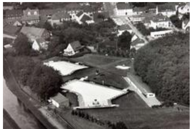
Waldschwimmbad mit Umkleidegebäude, Pumpenhaus und Wohnhaus der Schwimmmeisterfamilie

Mit dem neuen Schwimmbad sollte es auch eine Belebung des Schwimmsportes in Barnstorf geben. Die Chronik des MTV weist jedoch auf Schwierigkeiten hin, die sich dabei ergaben. Geplante Veranstaltungen konnten des Öfteren wetterbedingt nicht stattfinden: