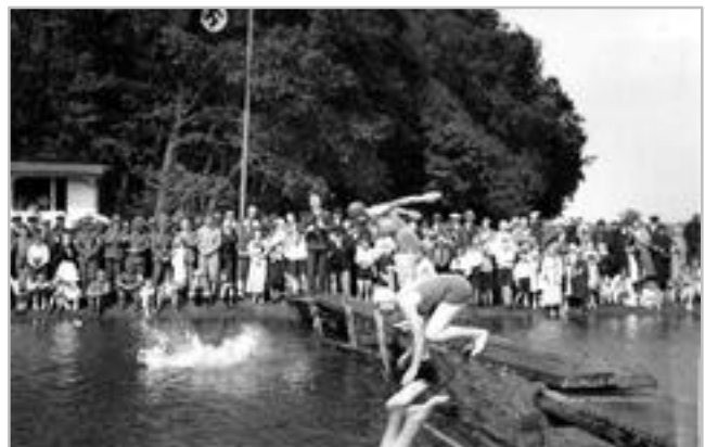
Schwimmwettkampf in der Hunte