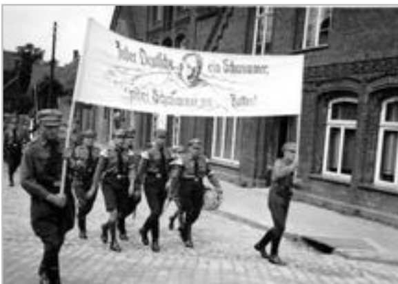
1937 Marsch zum Schwimmfest Kirchstr

Im Jahr 1937 vollzog sich auch in Barnstorf die politisch erzwungene ‚Gleichschaltung‘ des Sports: Der MTV und der Fußballverein Germania von 1929 wurden mit den NS-Sportgruppen von HJ, SA und SS zur ‚Sportgemeinschaft Barnstorf‘ zwangsfusioniert. Eigenständiges Vereinsleben war damit nicht mehr möglich; der Sport wurde systematisch in den Dienst der NS-Ideologie gestellt.