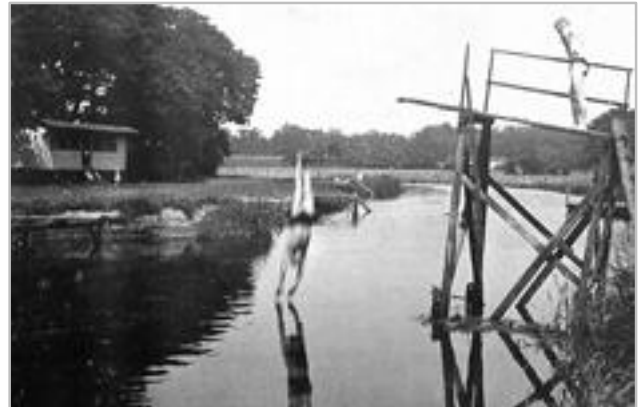
Anfang 1930er Jahre Badestelle an der Hunte mit Umkleiden und Sprungturm