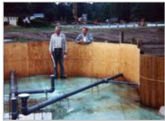
1990-1991 Neugestaltung des Schwimmbades