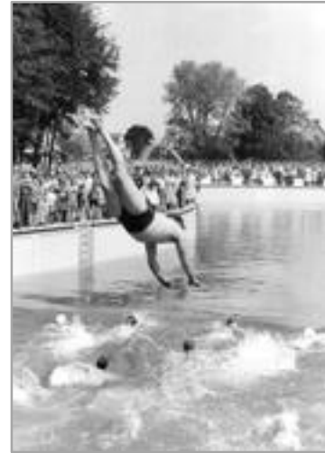
Die Schwimmer des MTV bei der Eröffnungsfeier