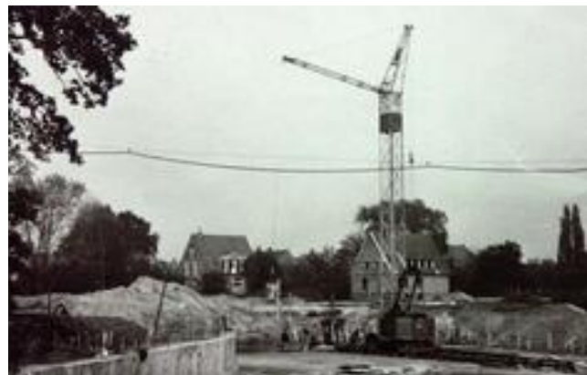
Erstellung der Becken

Direkt neben dem Schwimmbad wurde ein Wohnhaus für erstellt. die Familien des Gemeindedirektors und des Schwimmmeisters erstellt Nach einer Bauzeit von ca. 9 Monaten waren die meisten Arbeiten an dem neuen Bad und dem Wohnhaus abgeschlossen.