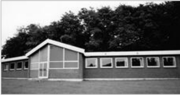
1972 Neubau Physiopraxis mit Sauna

Im Jahr 1972 entstand ergänzend im hinteren Bereich des Walschwimmbades eine Physiopraxis mit öffentlicher Sauna. Erste Betreiber sind das Ehepaar Gunter und Ulrike Britsche.