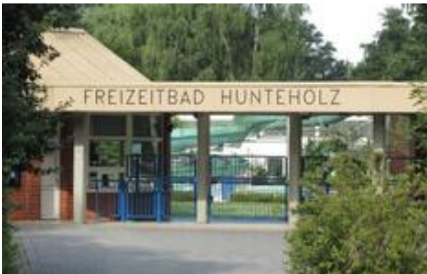
Eingangportal des neuen Freizeitbades