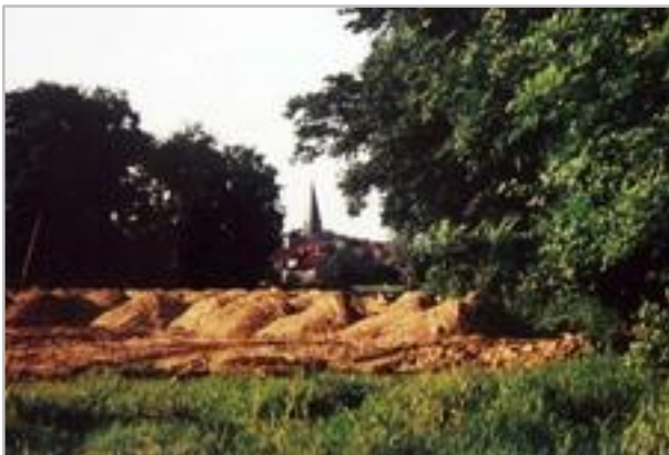
Sommer 1958 Auffüllen des Geländes

Im Sommer 1958 wurde das Erdreich auf dem Gelände aufgefüllt und die Gruben für die Becken ausgehoben. Am 11.09.1958 erfolgte die Grundsteinlegung. Die Bauleitung übernahm der Barnstorf Architekt und Bauingenieur Adolf Brennecke.