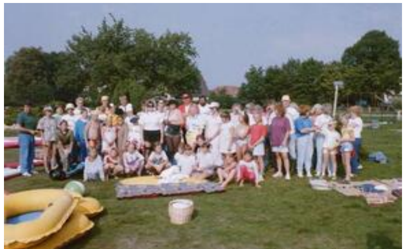
1989 Teilnehmer beim Abschwimmen

1989 fand das letztes Schwimmfest der Schwimgemeinschaft Barnstorf im alten Bad statt. Im September wurde das traditionelle „Abschwimmen“ der SG mit Verkleiden, Wasserspielen und anschließendem Grillbuffett gefeiert.