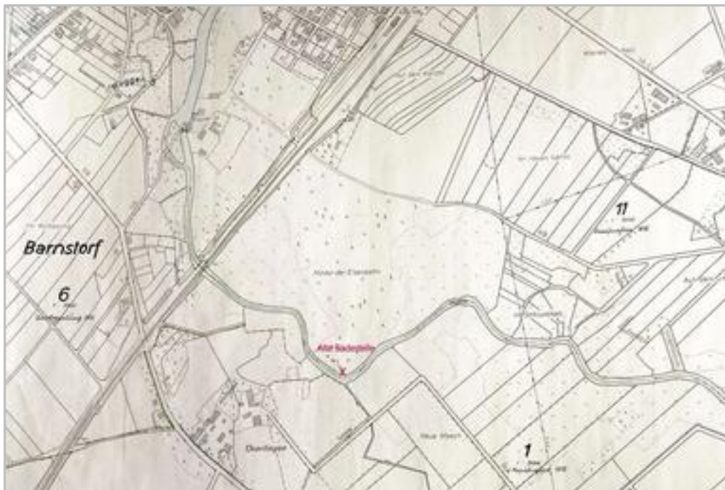
1958: Die Badestelle am Hunteholz in Höhe Överlingen

„1920 wurde der Schwimmverein gegründet. Die Badeanstalt und die breite und tiefe Hunte oberhalb der Eisenbahnbrücke wurden für angehende Schwimmer zum Übungsfeld.“