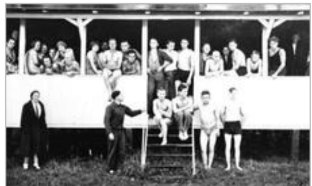
Teilnehmer am Lebensrettungskurs